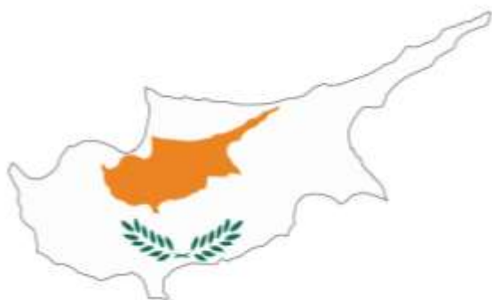
Кипър / Cyprus Regional Gymnasium of Livadia, Larnaka