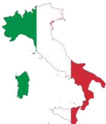
Италия / Italy “I. Comprensivo Velletri Centro- A. Velletrano” Velletri