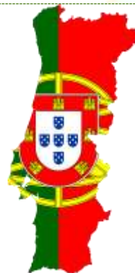
Португалия / Portugal “Escola Básica D.Duarte” “Agrupamento de Escolas de Viseu Norte” Viseu