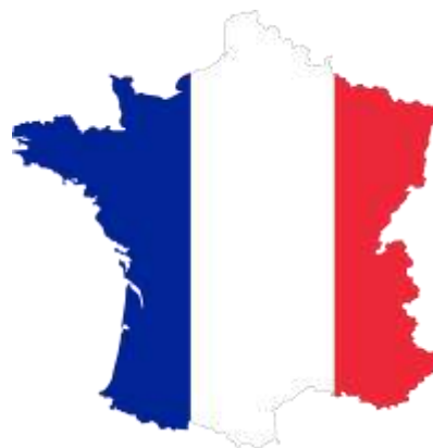
Франция / France College Pierre Mendes, St André