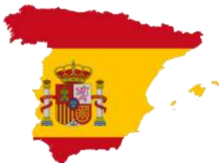
Испания / Spain “IES Miguel Romero Esteo”, Malaga

The schools joining the Project ‘Let’s be Eco-sustainAble are: