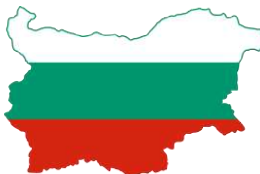
България / Bulgaria 51 Secondary and Primary School "Elisaveta Bagryana", Sofia